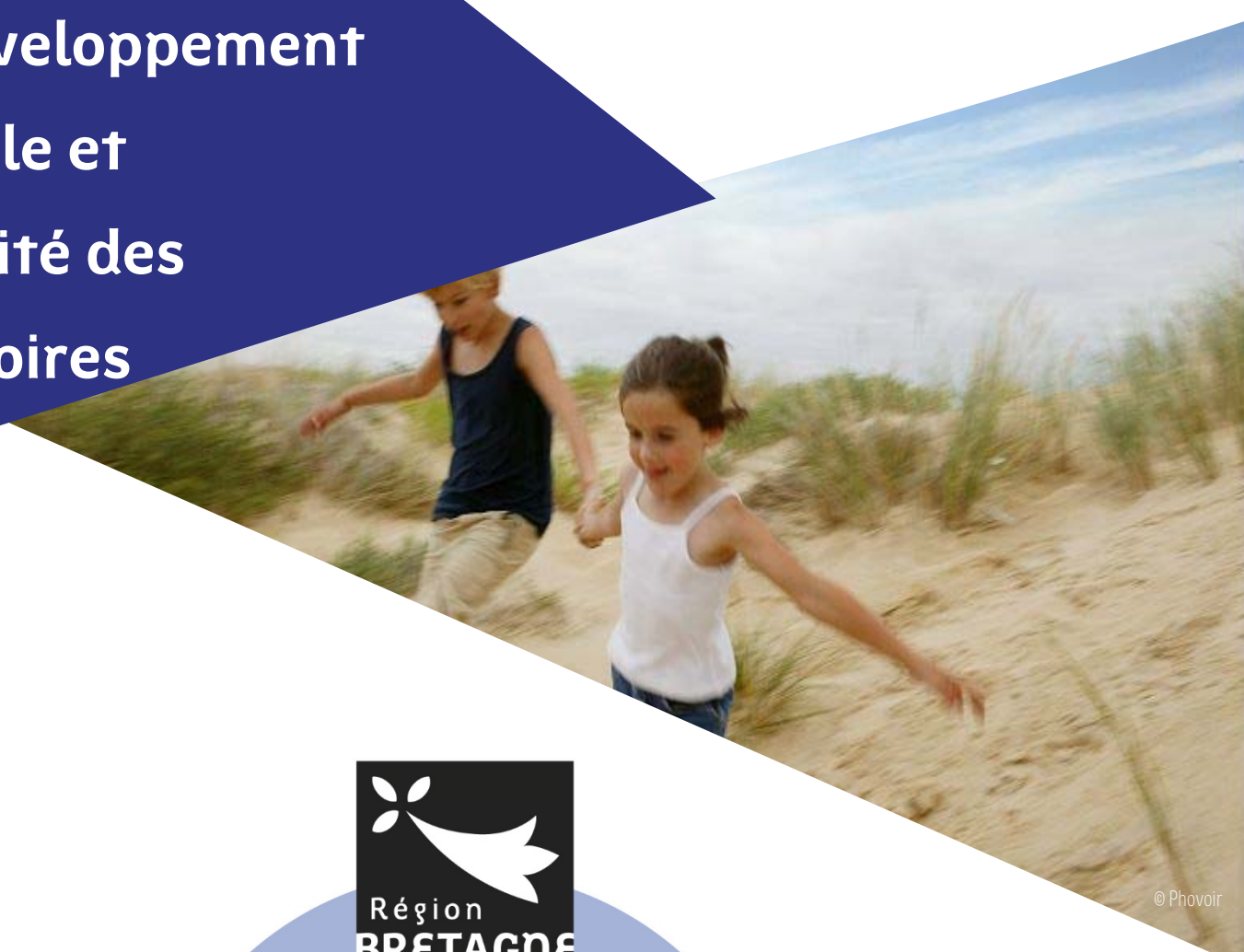
Schéma Régional d'Aménagement, de Développement Durable et d'Égalité des Territoires